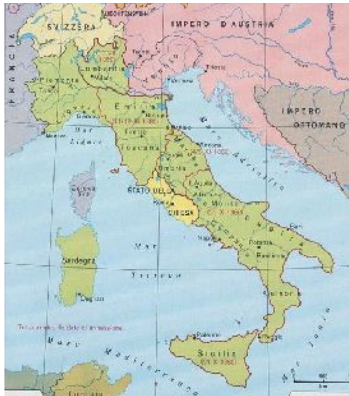
Il Regno d'Italia nel 1861