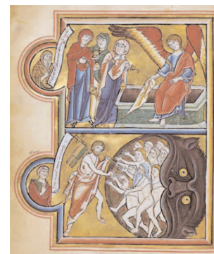
Pasqua, Codice miniato

Per arrivare ad ottenere gli obiettivi prefissati è opportuna una buona programmazione da parte degli insegnanti. Soprattutto per un bambino con particolari problemi, l'insegnante deve creare uno spazio ben individualizzato, identificando e procurando ausili e software opportuni e deve permettere di «giocare» solo con software che hanno un'intenzione educativa.